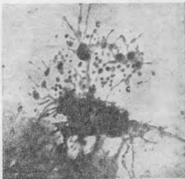
3. ábra. Vérlemezke (B) a belőle kiszabadult szemcsékkel (C—C).

A vörsejtekből kiszabaduló szemcséket kimutattuk a keringő vér savójában is. Ezeknek a vérben keringő szabad szemcséknek sok és életfontos feladatai vannak a szervezet ép és kóros viszonyai között, melyekre szakközleményeinkben és előadásainkban már rámutattunk. Itt csak azt akarjuk érthetővé tenni, hogy a káros sugárzások elsősorban ezekre a legkisebb egységekre, vagyis a szemcsékre hatnak s ma még kiszámíthatatlan mértékben megzavarják azok egészséges kialakulását, valamint működésük teljes kifejtését. Kimutattuk, hogy a vérnek sok fontos sajátossága, pl. a vércsoportok jellege is ezekhez a szabad szemcsékhez van kötve. Mint említettem, más szervek sejtjei, pl. a csirasejtek is termelik a maguk szemcséit, de vizsgálataink közben azt látjuk, hogy valamennyi között legfontosabbak a vér sejtjeinek a szemcséi. A Szentírás ismerő kutató nem tud kitérni az Írásnak egy fontos verse elől, mely így szól: „A testnek élete a vérben van” (III. Mózes 17:11). Az atomrobbantások ártalmas sugárzásai kétségtele-