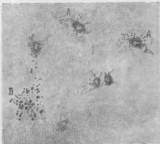
2. ábra. Fehér vörsejtek a vérpályán kívül. Festett készítmény. A—A = Szemcséket termelő fehér vörsejtek. B = Növekedésben lévő szabad szemcsék a környező szövetben.

valóan fokozódik és a meglévők mellett még újabb megbetegedések is várhatók. Ezt a tényt nem lehet zemmiféle lekicsinylő (bagatellizáló) nyilatkozatokkal megcáfolni. Jogosan ül tehát az atomveszélyből származó aggodalom százmilliók lelkében. Pár hét előtti nyugateurópai utam egyik tanulsága az volt, hogy az emberek milliói ott úgy körül vannak véve ezzel az aggodalommal, mint valami sűrű köddel.