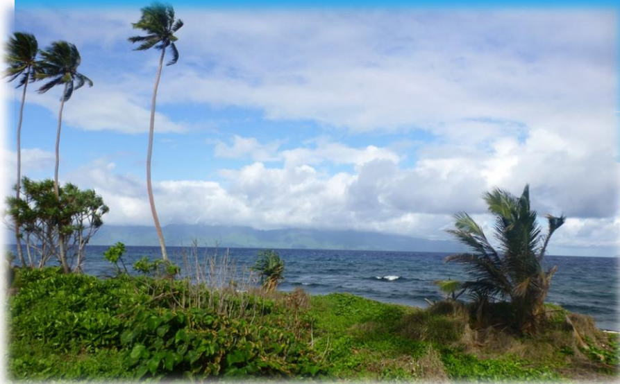
Ambae sziget tengerpartja