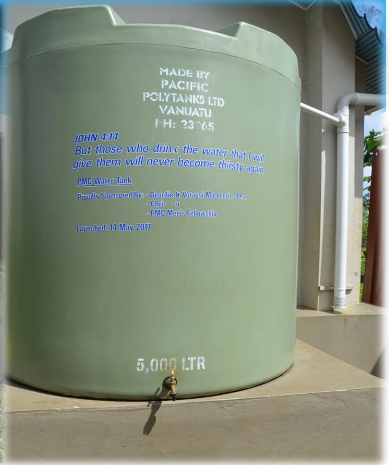
Városi víztartály (Port Vila)