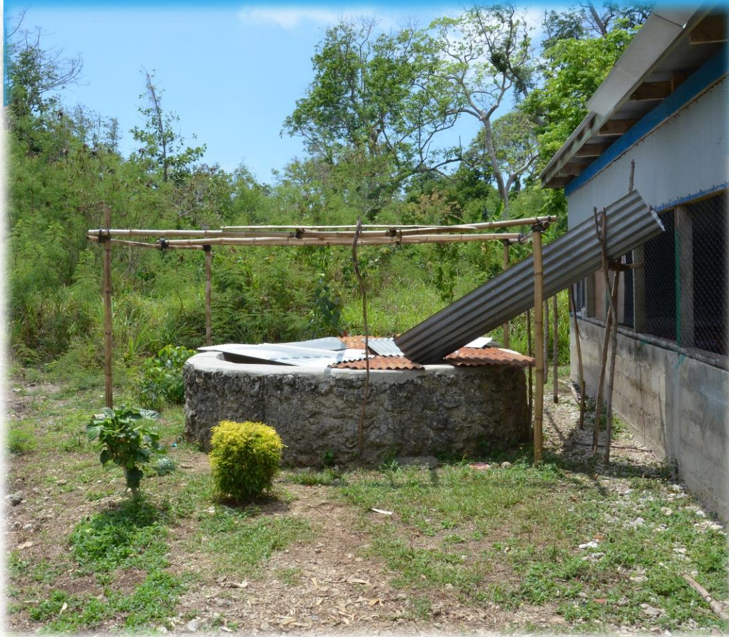
A falu kútja