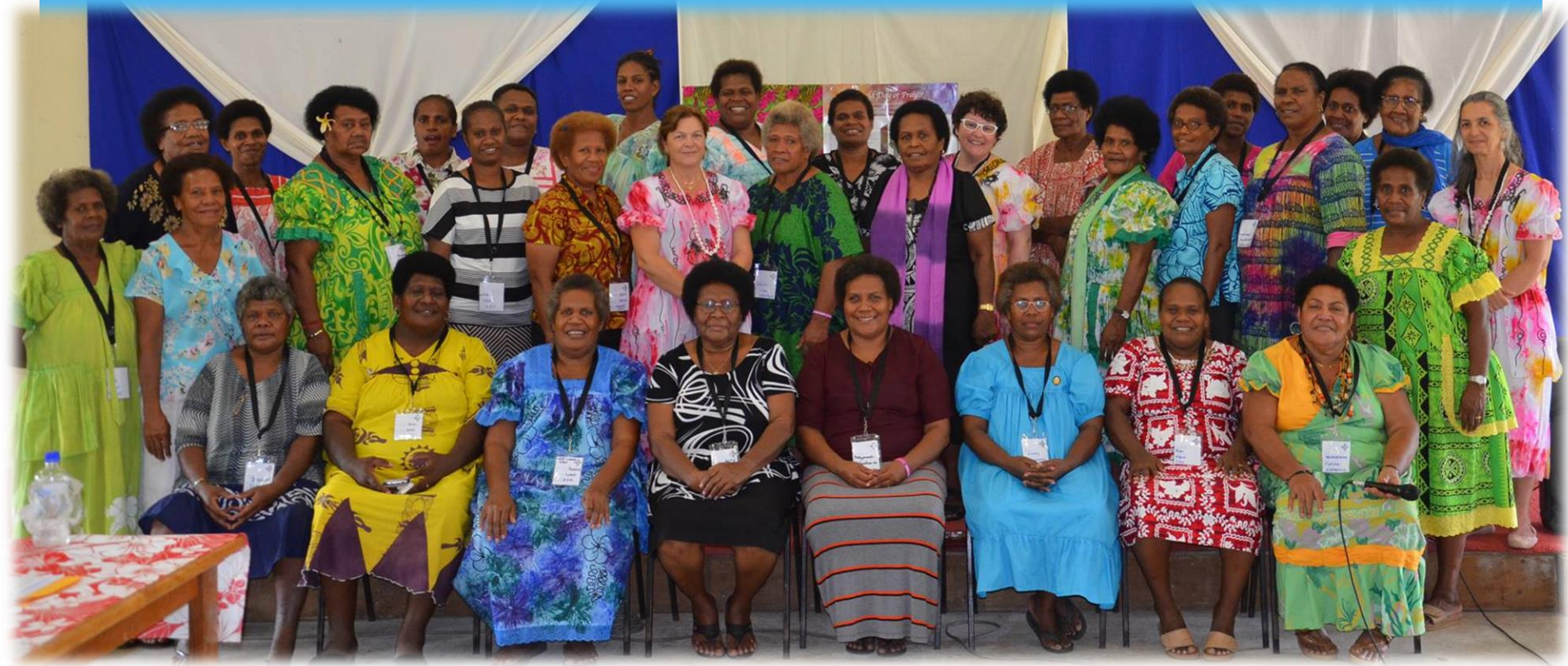
WDP Vanuatu Committee