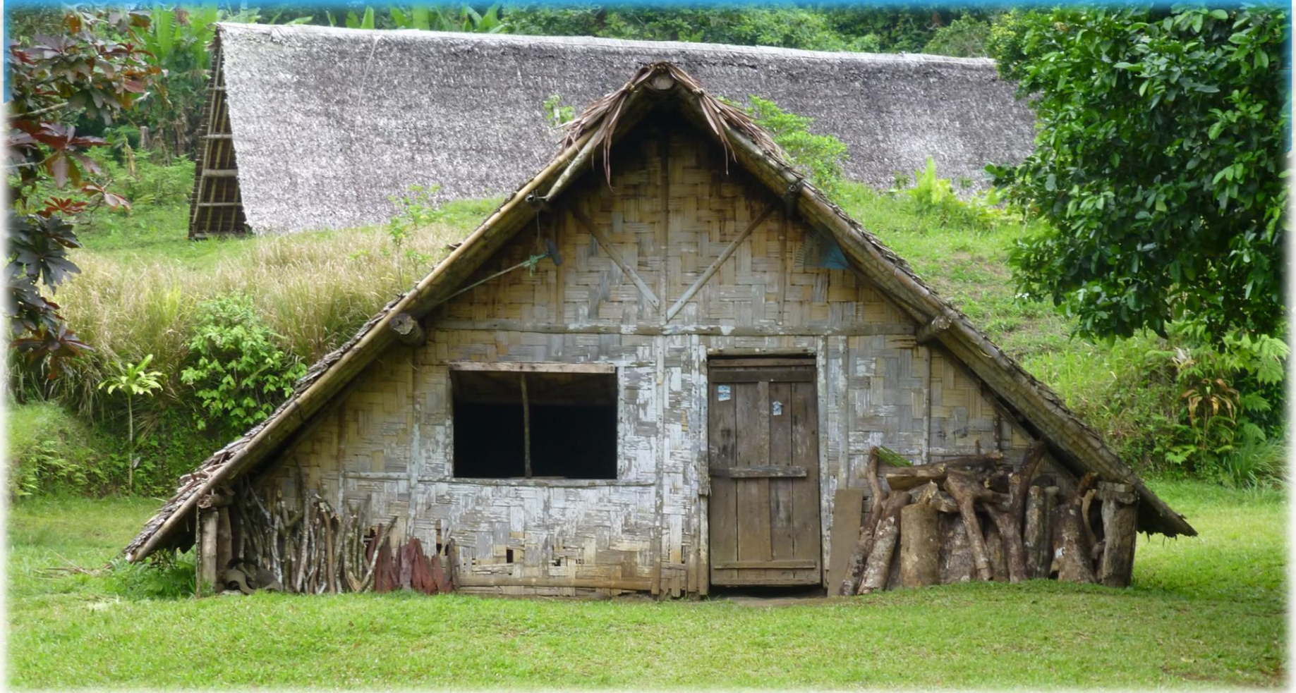
Tapasztott falú ház