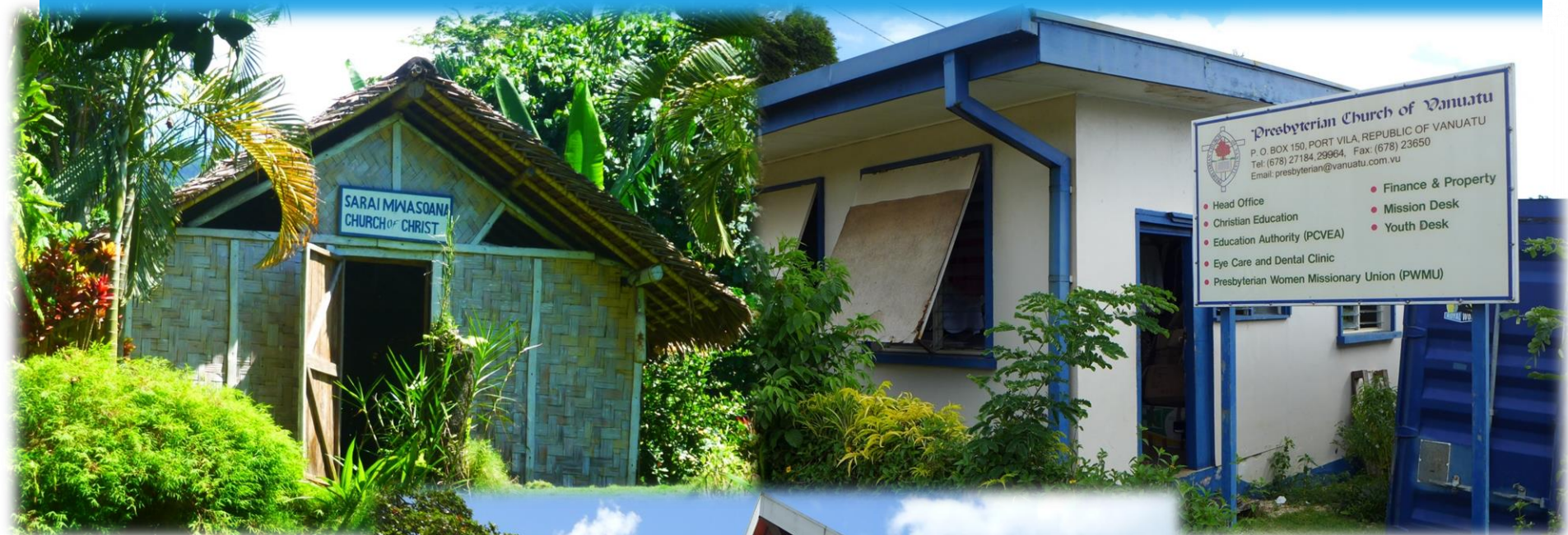
Krisztus Egyháza temploma