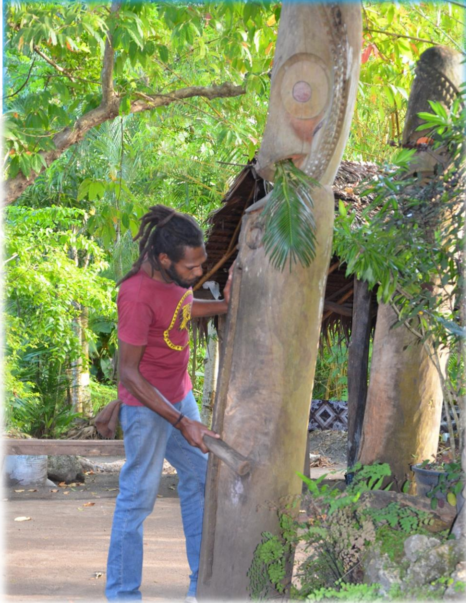
Réselt dob (slit drum)