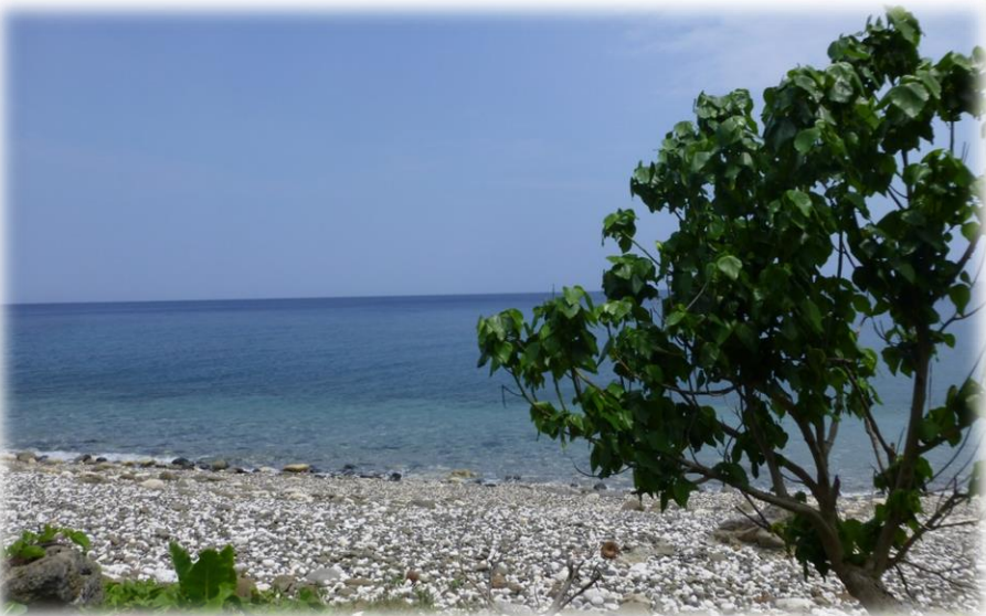
Pentecost (Pünkösd) sziget