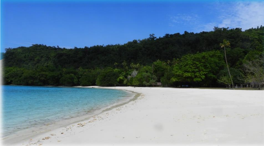
Espiritu Santo szigetén található Tengerpart Pezsgő