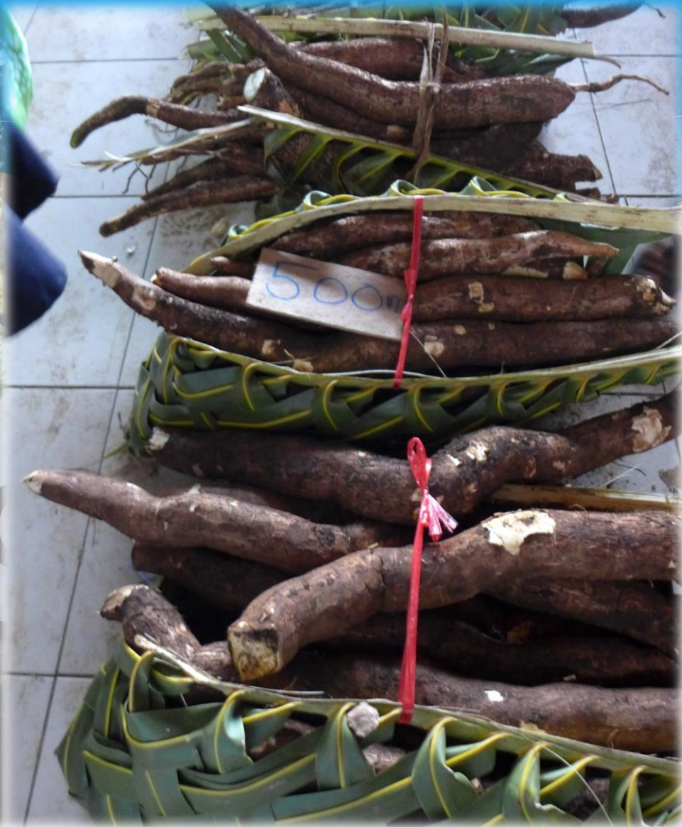
Cassava (manióka) gyökér