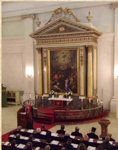
(1052 Budapest, Deák Ferenc tér 4.)