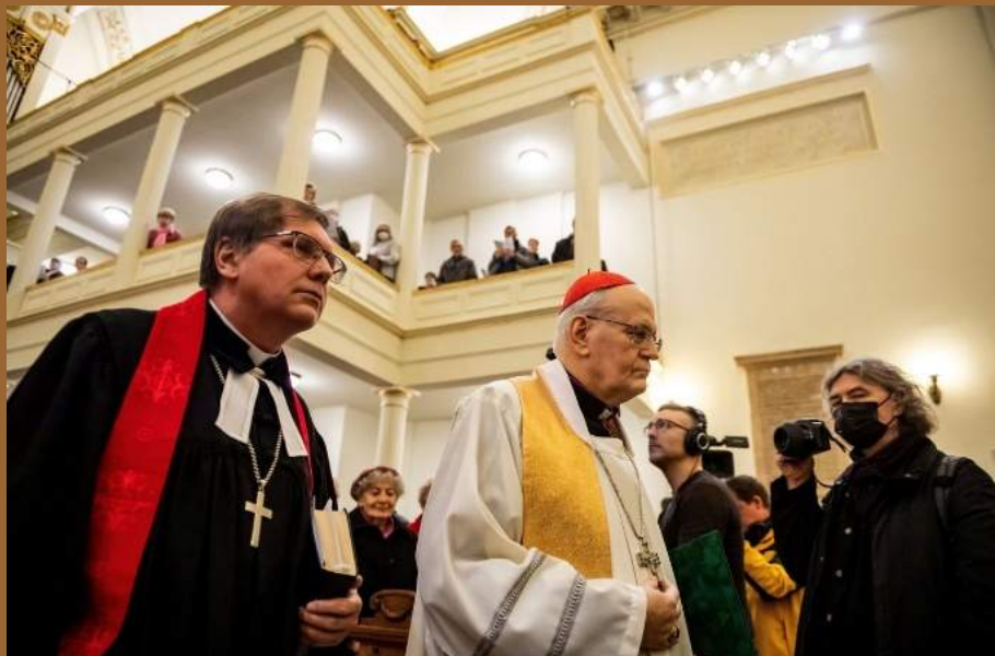
Fabiny Tamás, a Magyarországi Evangélikus Egyház elnök-püspöke és Erdő Péter bíboros, esztergom-budapesti érsek az ökumenikus imahét megnyitóján

Szentbeszédben ERDŐ PÉTER bíboros, esztergom-budapesti érsek Máté evangéliuma 25. részének 31–40. verse alapján beszélt a jó cselekedetokról, a szolgálatkész szívről, melynek mindenki felé kell irányulnia, és nem csupán ismerősi, baráti körünkben. „ Bizony, mondom néktek, amikor megtettétek ezeket akárcsak egygel is a legkisebb atyámfiai közül, velem tettétek meg ” (Mt 25,40.) — hangzik Jézus, az eljövendő Király bátorítása és válasza a gyülekezetnek.