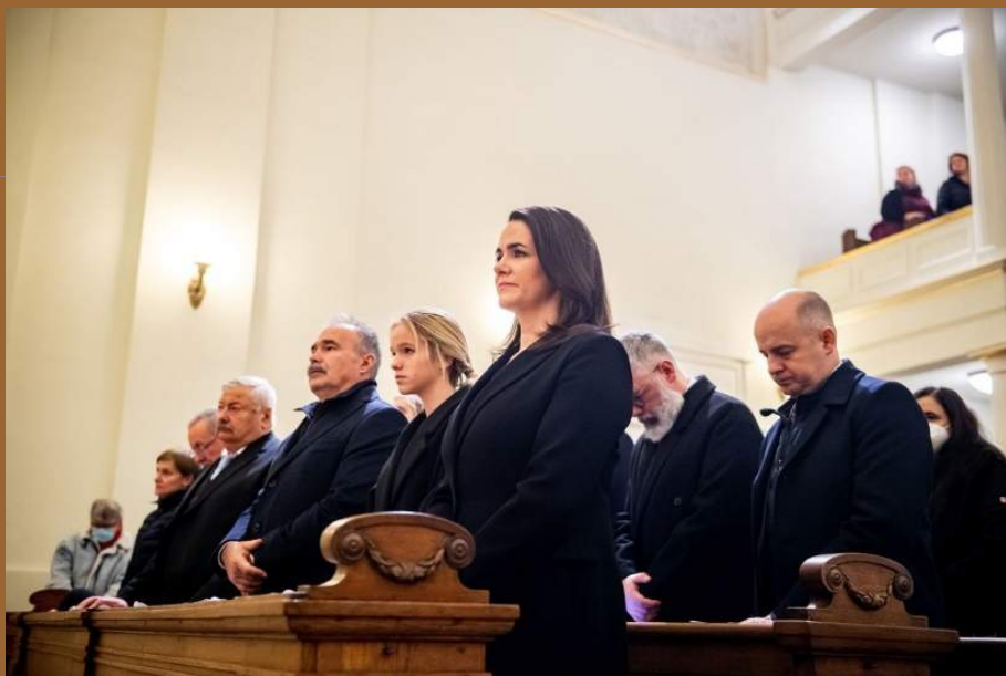
Novák Katalin köztársasági elnök és Nagy István agrárminiszter is részt vett az istentiszteleten

A mai alkalom csak a kezdete annak hétnek, melynek folyamán az országszerte számtalan közösségben és templomban megrendezett imaheti összejövetel lehetőséget és teret ad a szeretetközösségre, ahol más felekezeti testvéreinkkel együtt könyöröghetünk a Krisztus-hívők egységéért. Az idei imahét bibliai mottója az Ézsaiás próféta könyvéből vett idézet: „ Tanuljatok meg jót cselekedni, törekedjétek igazságra. Tanuljatok meg jót tenni: keressétek az igazságot ”. (Ézs 1,18.) Az imaheti füzet a Magyarországi Egyházak Ökumenikus Tanácsa honlapjáról tölthető le .